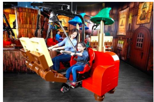
マーリン・アプレントイス