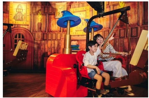
マーリンアプレンティス