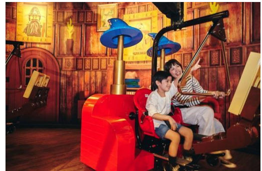
マーリンアプレントイス