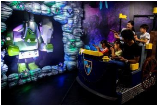
キングダムクエスト