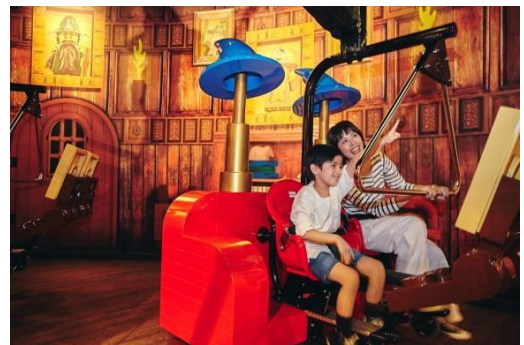
マーリンアプレンティス