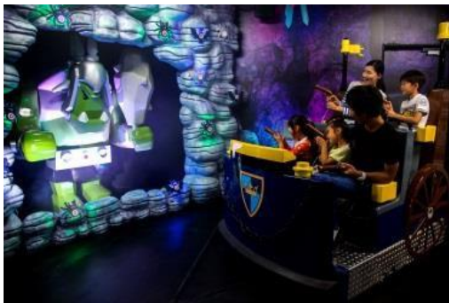
キングダムクエスト